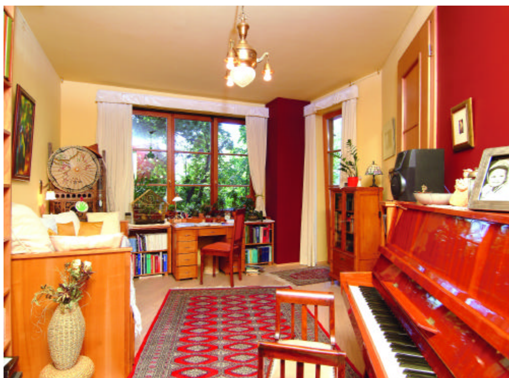
Alapterület: 250 m 2

■ Sok ötlet rejtőzik a dolgozószobában is. A könyvespolcból kiugró képtartó dobozok másik oldalán a hálóból nyíló gardróbhelyiség polcai kaptak helyet. A könyvespolc a Juhar 89 Bt. mestereinek munkája